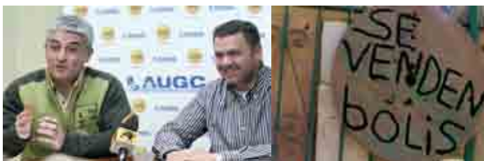
Miembros de la Junta Nacional de AUGC. Esta imagen habla por sí misma.

No sólo la prensa escrita ha suscitado el interés por la campaña. Estos días atrás, hemos podido ver y oír a través de las distintas televisiones y radios nacionales y autonómicas, varios reportajes sobre el asunto donde nuevamente, dirigentes de AUGC han dado la cara públicamente para explicar la situación al resto de ciudadanos. En nuestra web, puedes obtener enlaces a algunos videos y audios extraídos de las cadenas radiofónicas: http://www.augc.org